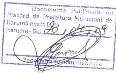
WILMAR BENTO SEVERINO Prefeito Municipal

GABINETE DO PREFEITO MUNICIPAL DE ITARUMÃ/GO, aos 20 (vinte) dias do mês de abril de 2009 (dois mil e nove).